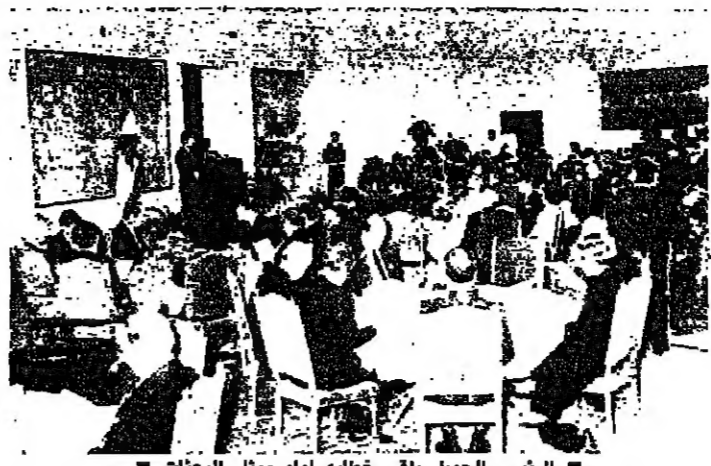
الرئيس الجميل يلقى خطبه أمام سفري الميثاق